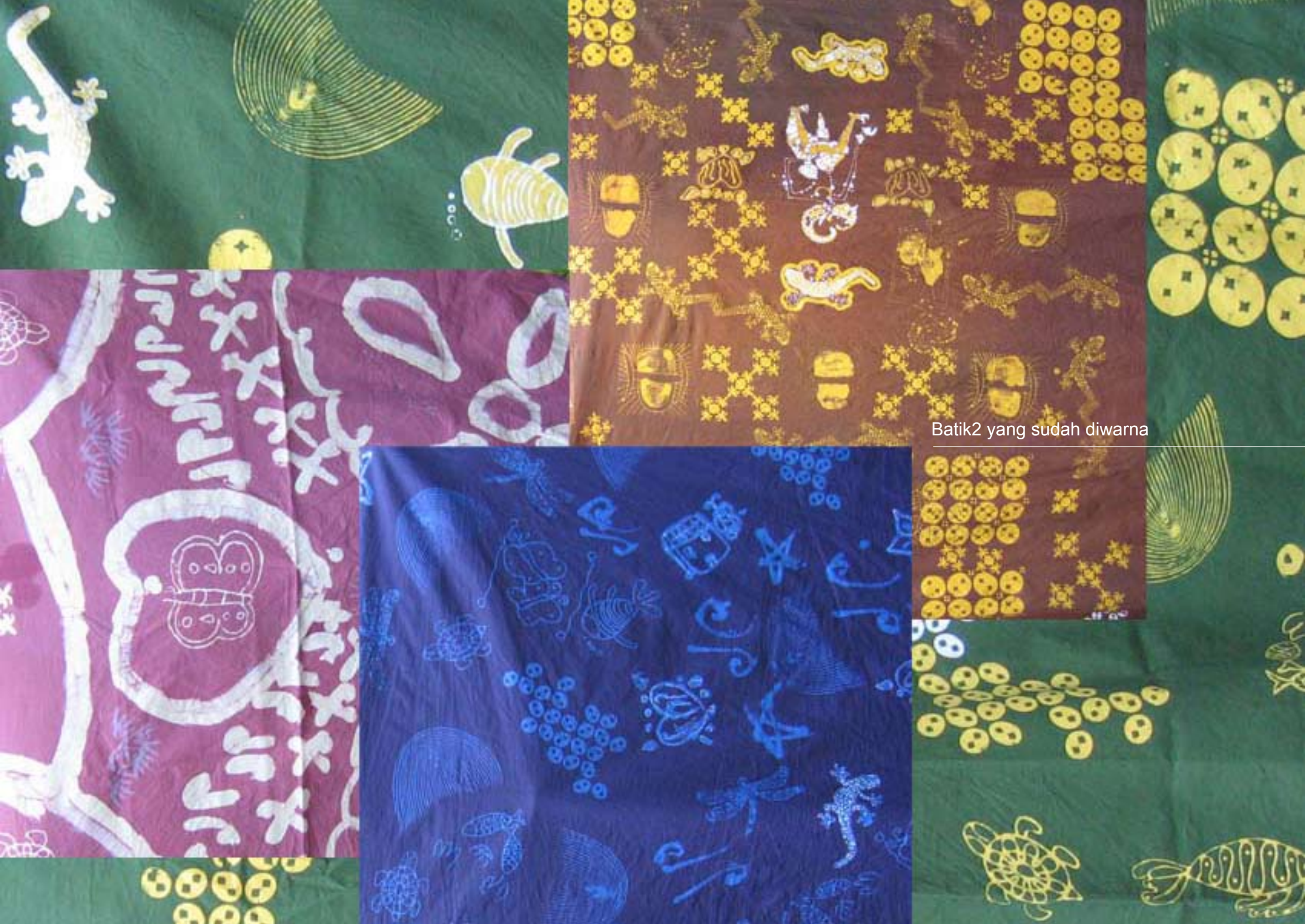
Batik2 yang sudah diwarnai