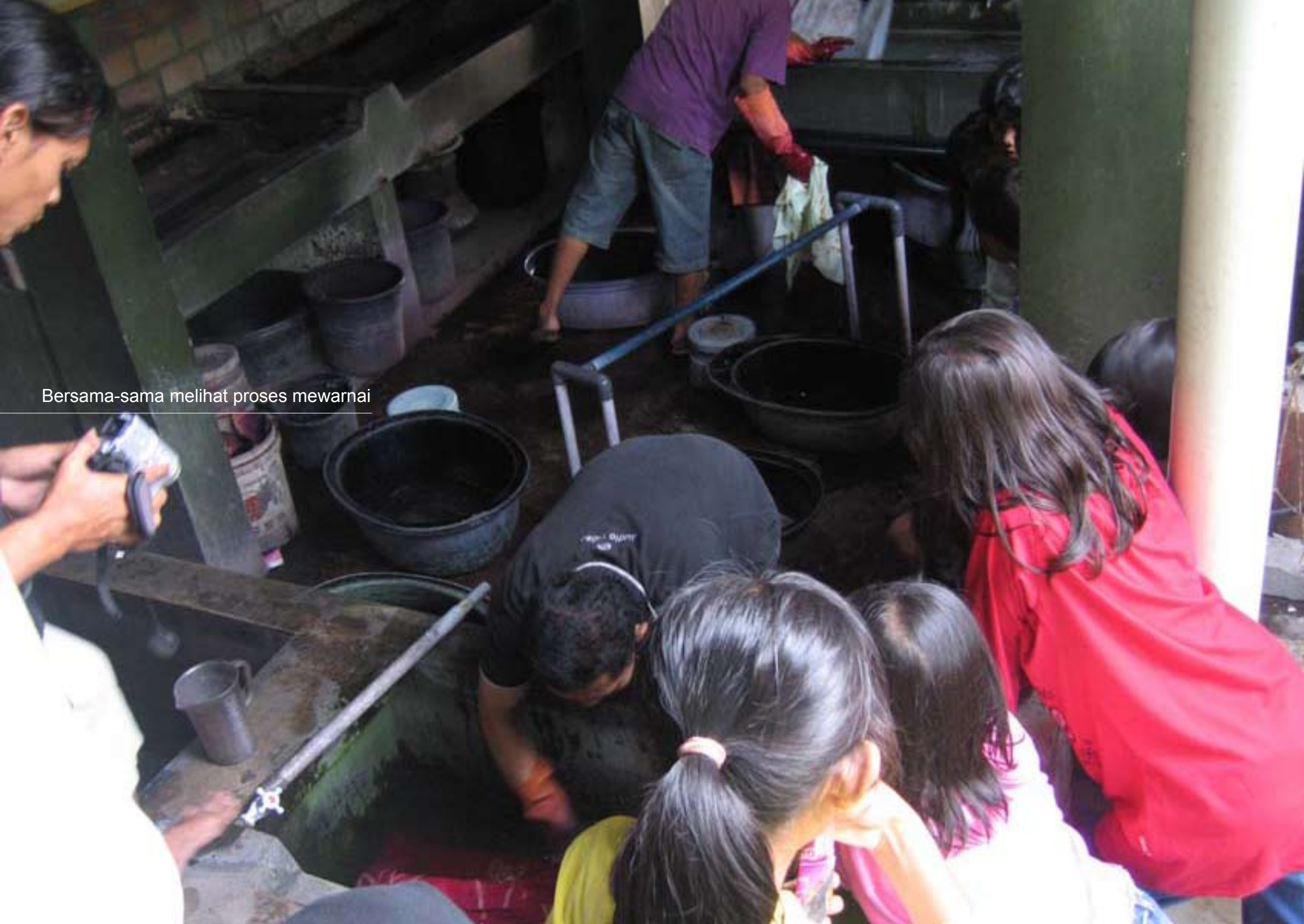
Bersama-sama melihat proses mewarnai