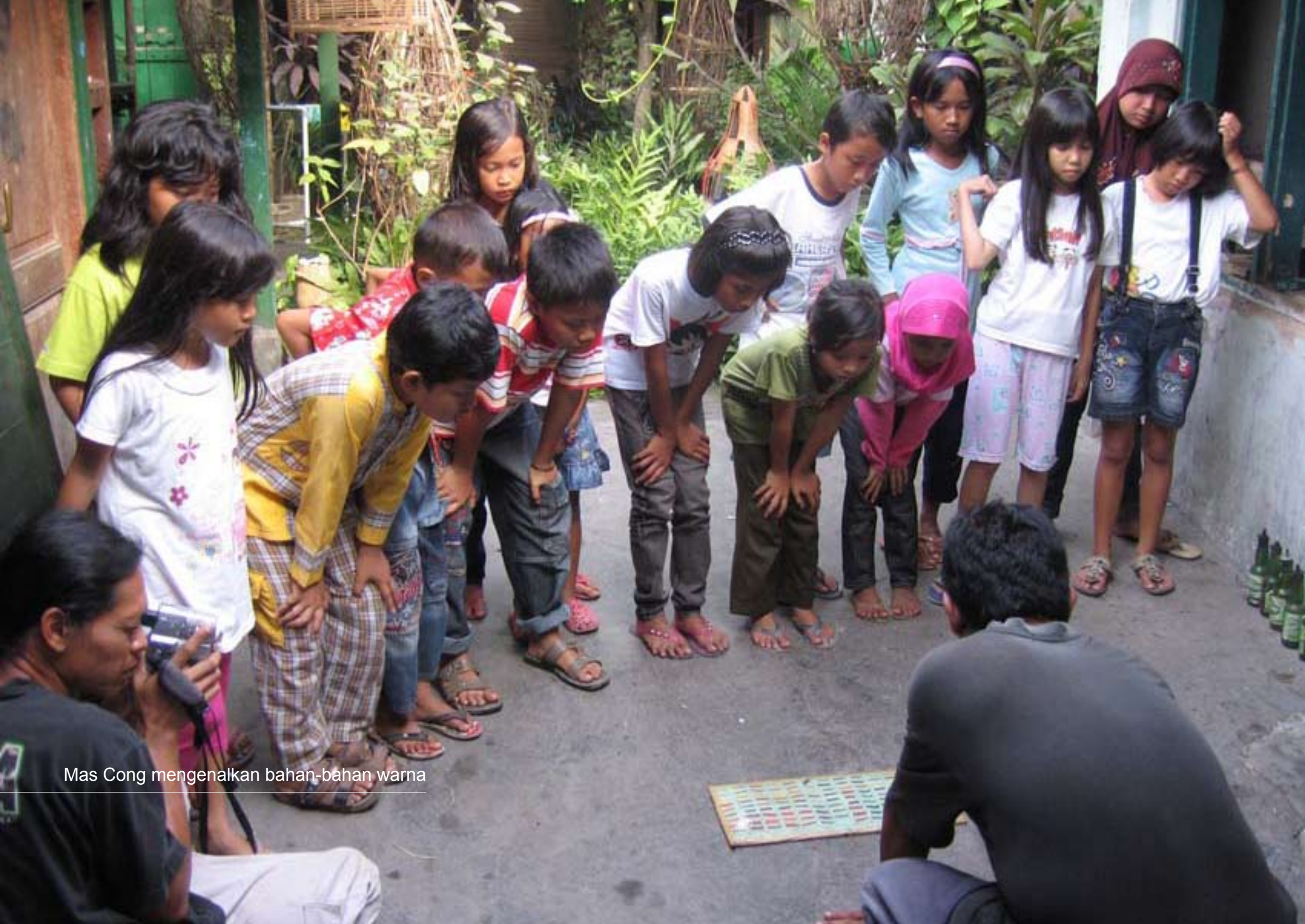
Mas Cong mengenalkan bahan-bahan warna