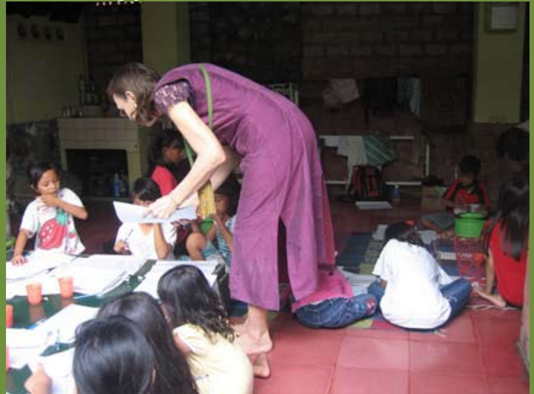
Anak2 membuat sketsa untuk cap